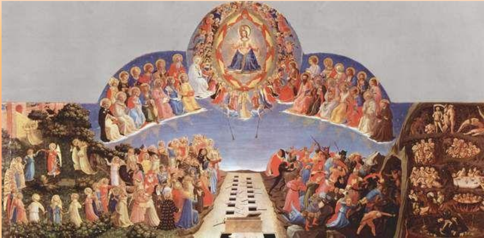
Fra Angelico, Das Jüngste Gericht (1432-1435)